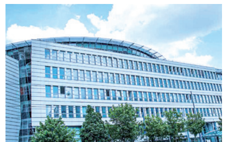
Amundi Deutschland GmbH, München

Seit 2014 trägt die DRAABE Luftbefeuchtung zum Wohl der Mitarbeiter bei und sorgt für ein gesundes Raumklima. „Die Bedeutung optimaler Luftfeuchtigkeit am Arbeitsplatz ist nicht zu unterschätzen“, so Mutzl.