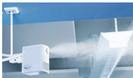
88 DRAABE NanoFog Evolution und Sens sind in den attraktiv gestalteten Räumen von Amundi Deutschland im Einsatz