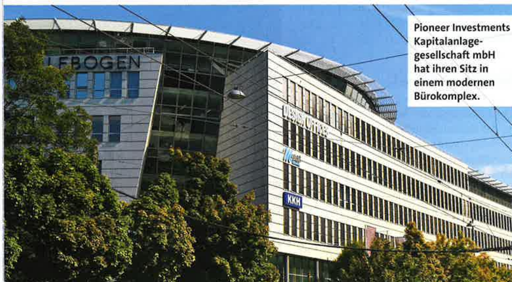
Pioneer Investments Kapitalanlage-gesellschaft mbH hat ihren Sitz in einem modernen Bürokomplex.

In modernen Bürogebäuden deuten ausgetrocknete Schleimhäute, Augenbrennen und Hautreizungen häufig auf eine extrem niedrige relative Luftfeuchte. Bei Pioneer Investments, einem Unternehmen der Amundi Gruppe, sind seit 2014 über 80 Direkt-Raumluftbefeuchter im Einsatz, um die Gesundheit der Mitarbeiter vor den Folgen zu trockener Luft zu schützen. Nach drei Jahren Erfahrung sind Mitarbeiter und Führungskräfte von der positiven Wirkung der Luftfeuchte überzeugt.