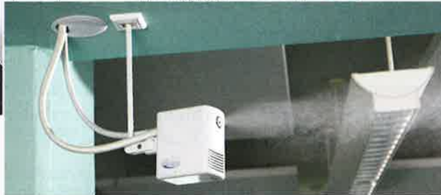
Draabe NanoFog Direkt-Raumluftbefeuchtung