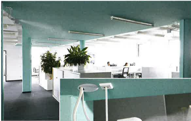
Open-Space-Büroflächen mit Direkt-Raumluftbefeuchtung