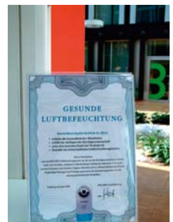
Dokumentierte Sicherheit: Das Zertifikat „Optimierte Luftbefeuchtung“ im Foyer bei Bristol-Myers Squibb

Squibb am Standort München einen energieeffizienten Beitrag zum Wohlbefinden und Gesundheitsschutz seiner Mitarbeiter umgesetzt.