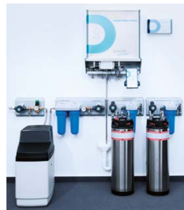
DRAABE TrePur Compact