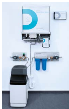
DRAABE DuoPur Compact

Mit wenigen Handgriffen ist der benutzte DRAABE Pur Container gegen ein rundum gewartetes System ausgetauscht. Hygiene und Sicherheit sind so immer garantiert – ohne zusätzliche Kosten, Zeit und Aufwand.