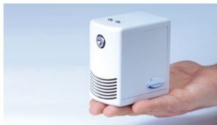
DRAABE NanoFog Evolution: passt in jedes Gebäude