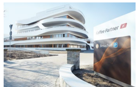
Kaffee Partner GmbH, Osnabrück

Der mehrstöckig terrassenförmig angelegte Verwaltungsbau fällt bereits von Weitem auf. Auf 5.000 m 2 Fläche bietet das Gebäude für die rund 400 Mitarbeiter eine helle, transparente Raumgestaltung, geprägt durch warme Farben, weiche Formen, individuelle Beleuchtung und optimale Akustik.