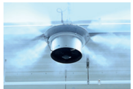
Hochdruck-Luftbefeuchter ML Princess von Condair Systems

Seit 2013 produziert das Unternehmen auch im polnischen Rawicz: Über 100 Mitarbeiter der Fritz Hansen Production Sp. z o.o. sind dort verantwortlich für die Herstellung hochwertiger Design-Stühle. In den sensiblen Fertigungsbereichen spielt ein standardisiertes Raumklima und eine kontrollierte Luftfeuchte eine wichtige Rolle für die Qualitätssicherung.