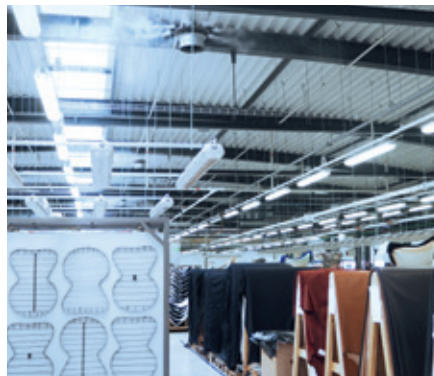
Eine geregelte Luftfeuchte ist Teil des Qualitätsmanagements bei Fritz Hansen