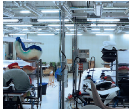
Eine relative Luftfeuchte von 40 % sichert die hochwertige Verarbeitung der Design-Stühle

Condair Systems GmbH Nordportbogen 5 22848 Norderstedt Telefon: +49 40 853277-0 Telefax: +49 40 853277-44 E-Mail: info@condair-systems.de Internet: www.condair-systems.de