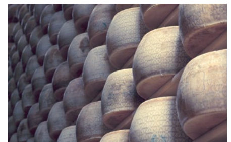
Luftbefeuchtung in der Lebensmittelindustrie

Condair Systems GmbH Nordportbogen 5 22848 Norderstedt Telefon: +49 40 853277-0 Telefax: +49 40 853277-44 E-Mail: info@condair-systems.de Internet: www.condair-systems.de