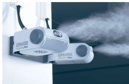
Der DRAABE TurboFogNeo 2x2

fest verankert. Neben dem weltweit geltenden Zertifikat „Optimierte Luftbefeuchtung“ ist die DRAABE Luftbefeuchtungsanlage auch nach der neuen VDI-Richtlinie 6022 Blatt 6 zertifiziert. Diese beschreibt den aktuellen Stand der Technik und garantiert einen einwandfreien Betrieb – ein stets störungsfreier und hygienisch sicherer Einsatz der Befeuchtungsanlage ist somit gewährleistet.