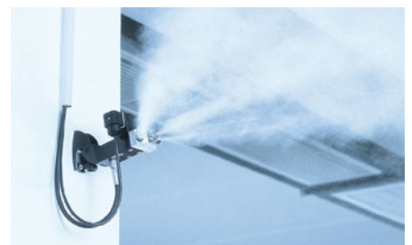
Hochdruck-Vernebler DRAABE DI Flex

In Kühllhäusern und Schockfrostschleusen ist eine relative Luftfeuchte von 95 % optimal, um Gewichtsverluste durch Schwarten-Austrocknung und Borkenbildung zu minimieren. Die DRAABE Hochdruck-Düsen-Systeme reduzieren die Kühlverluste in Kühllhäusern von durchschnittlich 2,4 % auf 1,6%. Das Praxisbeispiel eines Schweineschlacht- und Zerlegebetriebes zeigt, dass sich die Investition bereits nach knapp einem Monat amortisiert.