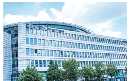
Pioneer Investments Kapitalanlagegesellschaft mbH, München

Seit 2014 trägt die DRAABE Luftbefeuchtung zum Wohl der Mitarbeiter bei und sorgt für ein gesundes Raumklima. „Die Bedeutung optimaler Luftfeuchtigkeit am Arbeitsplatz ist nicht zu unterschätzen“, so Mutzl.