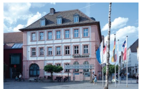
Geschäftsstelle Karlstadt der Sparkasse Mainfranken Würzburg

Die Geschäftsstelle in Karlstadt ist bereits die zweite Filiale des Kreditinstituts mit einer zusätzlichen Luftbefeuchtung. Durch die Befeuchtung des Kundenzentrums, der Schalterhalle, der Kreditabteilung und weiterer Büroflächen profitieren Kunden und Mitarbeiter der fränkischen Sparkasse jetzt von einem gesunden und vitalisierenden Raumklima.