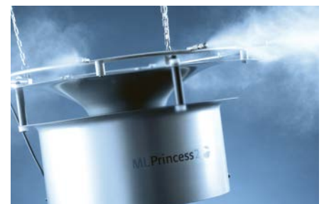
Ideal für hohe Hallen: ML Princess 2

Elektrostatik ist kein Problem mehr bei Preston Packaging