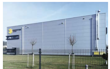
Preston Packaging in Poznan

Seit dem Umzug in das neue Firmengebäude sichert eine ML Direkt-Raumluftbefeuchtung optimale Klimabedingungen für den Druck und die Weiterverarbeitung. Eine konstante relative Luftfeuchte von 50% garantiert Preston Packaging einen störungsfreien Druckprozess ohne Materialverzug und mit hoher Passgenauigkeit beim anschließenden Stanzen und Kleben.